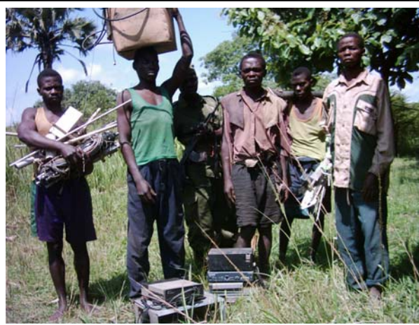
Les braconniers arrêtés en collaboration avec la population locale participent aux travaux dans la station de NAGERO.