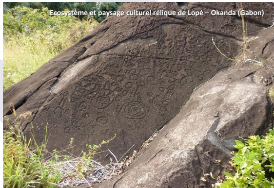
Ecosystème et paysage culturel rélique de Lopé – Okanda (Gabon)