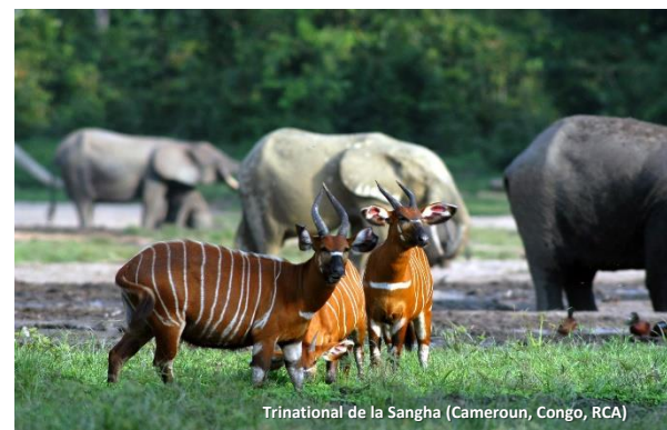
Trinational de la Sangha (Cameroun, Congo, RCA)