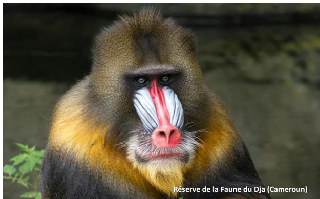
Réserve de la Faune du Dja (Cameroun)