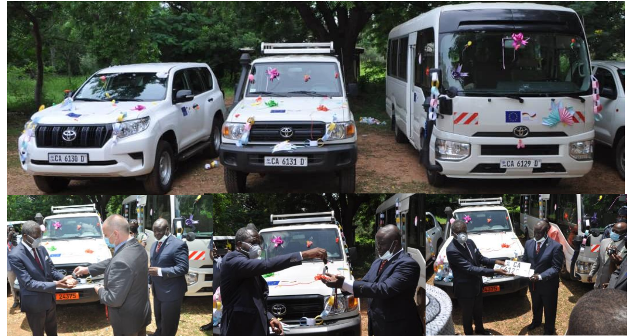
Remise solennelle des véhicules à l'EFG (28/08/2020)