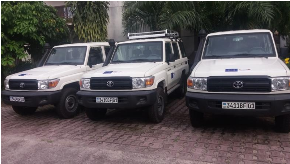
Renforcement de l'ERAIFT en équipement roulant (06/11/2019)