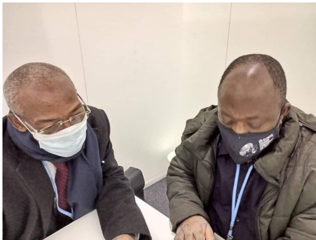
COP 26 Glasgow