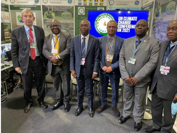
COP 26 Glasgow

La coopération a également été marquée par la franche collaboration avec le PFBC. Les réunions dans le cadre du Partenariat pour les Forêts du Bassin du Congo ont toujours constitué une des opportunités où les Etats et les partenaires réfléchissent ensemble sur les stratégies de mobilisation des ressources pour la mise en œuvre du plan de convergence de la COMIFAC.