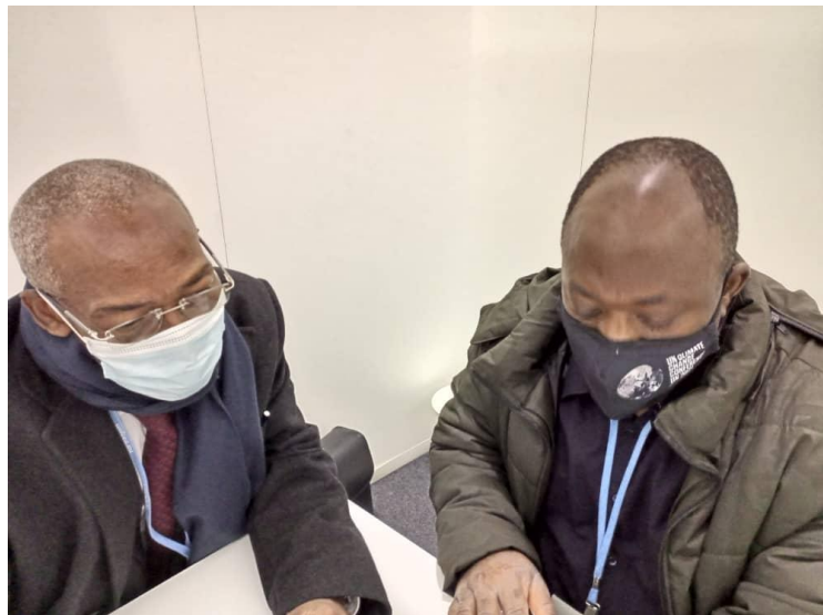
COP 26 climat Glasgow

Cela a été une grâce pour moi de travailler aux côtés de Monsieur le Ministre Jules Doret NDONGO, Président en Exercice sortant de la COMIFAC. C'est une grande personnalité avec une longue et riche carrière politique. Il a su mettre à profit sa très riche expérience au service de la COMIFAC tout au long de son mandat. C'est un sage, d'une grande humilité, qui a su à chaque fois lorsqu'il fallait prendre une décision, amener ses pairs vers un consensus. Il est très collaboratif, car il aime toujours recueillir les points de vues de ses experts sur certains dossiers avant de prendre une décision. Je l'ai trouvé également très humble et conciliant. Il était accessible par tous les moyens (téléphone, WhatsApp, mail, etc) ce qui a énormément facilité les échanges entre lui et moi. Monsieur le Ministre Jules Doret