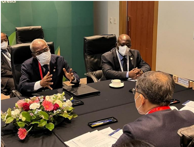
Congrès forestier Mondial Séoul